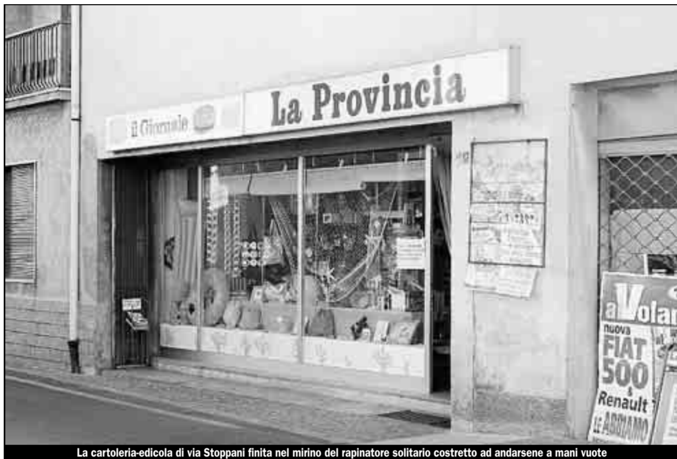
La cartoleria-edicola di via Stoppani finita nel mirino del rapinatore solitario costretto ad andarsene a mani vuote

Racconta il figlio: «Una reazione d'istinto. Credo non si sia nemmeno reso conto di quanto stesse facendo»